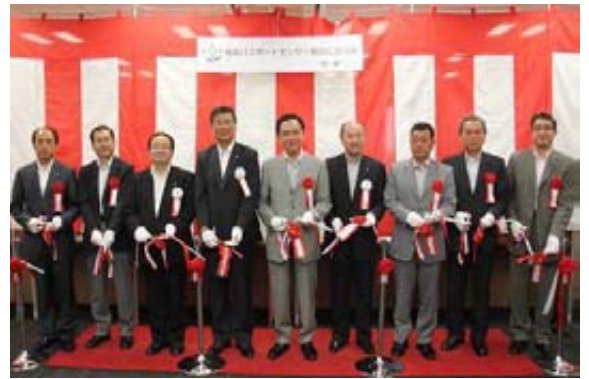
〔開設記念式典テープカットの様子〕

式典には、鈴木藤沢市長、服部茅ヶ崎市長、木村寒川町長のほか、黒岩神奈川県知事、2市1町の議会関係者等のご臨席をいただき、主催者の挨拶や来賓からのご祝辞の後、テープカットが行われました。