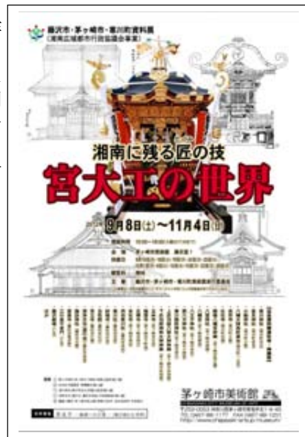
[資料展のリーフレット]