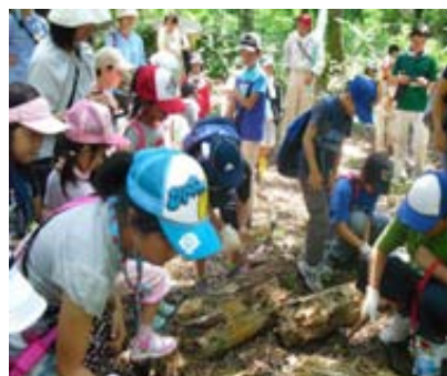
[森での探検の様子]

教室で大学の先生から森の樹木について教えていただいたあと、森(日本大学の演習林)へ出発。森では枯れて腐った朽木を子どもたちがハンマーで叩いて中にいる生き物を観察したり、森の中の溪流で沢ガニやヤゴ、川