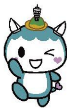
ふじキュン♡ (藤沢市)