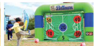
湘南スポーツキッズフェスタ