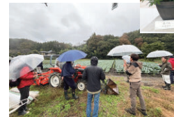
新規就農者の集い