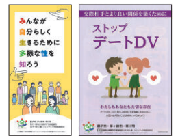
啓発リーフレット

各世代への意識啓発を目的として、小学生向け・高校生以上向けの人権ジェンダー平等啓発リーフレットを作成し、各学校等で配布したほか、DV防止啓発リーフレットを作成し、公共施設等で配布しました。