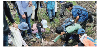
みどりの保全セミナー