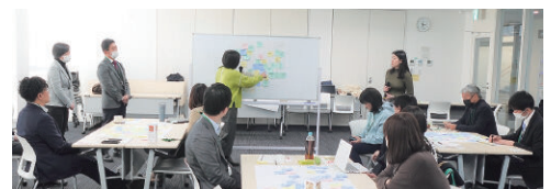
SDGs企業向け講演会・研修会