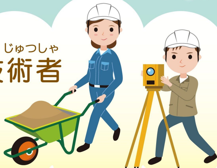
ぎじゅつしゃ 技術者