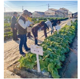
新規就農者の集い

令和5年11月22日(水)に埼玉県加須市のトキタ農園(株)大利根研究農場を訪問し、新品種や売れ行きの良い品種等の管理・作付け方法などの説明を受け、農場の栽培管理状況などを学びながら質疑応答を行いました。