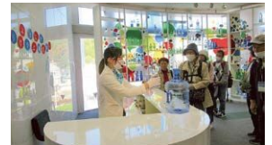
秋の企業見学(環境バスツアー)