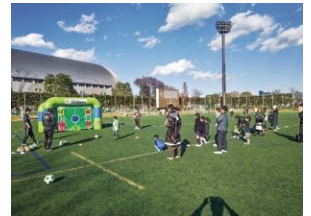
湘南スポーツキッズフェスタ

令和5年12月17日(日)に湘南スポーツキッズフェスタを開催し、キックターゲット、ドリブルサーキットなどのスポーツ体験のほか、湘南ベルマーレOB選手によるサッカークリニックが行われ、参加した親子と一緒にサッカーを楽しんでいました。