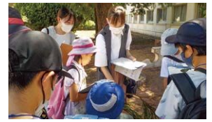
みどりの保全セミナー

12月17日(日)には気象予報士の天達武史さんを講師に招き、気候変動講演会「天達武史さんと学ぶ地球温暖化」を開催、地球温暖化問題などについてご講義いただきました。