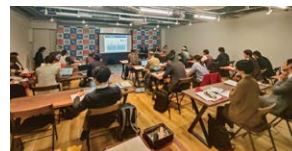
人材不足解消セミナー

令和7年10月24日(金)に2市1町圏域の企業を対象に人材不足解消セミナーを実施しました。1部はハローワーク藤沢の職員の方から、労働市場を的確に捉え、効果的な求人方法についてのセミナーを、2部は神奈川県産業振興課の職員の方から、ロボット導入による省人化についてセミナーを実施しました。