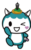
ふじキュン♡ (藤沢市)