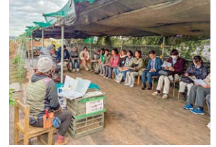
新規就農者の集い

令和7年11月11日(火)に横須賀・三浦地区の農園・農協・農業技術センターを訪問し、多品目生産と大産地の農業などの説明を受け、農場の栽培管理状況などについて質疑応答を行いました。