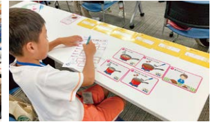
エコエコカードゲーム