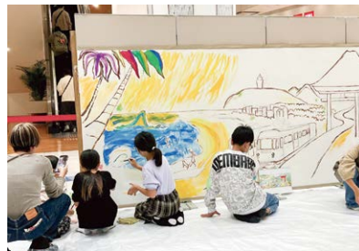
担い手育成事業(みんなでえがこう ひとつの未来)