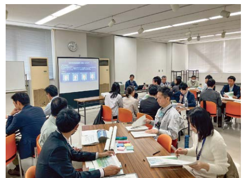
2040年問題の解決に向けた職員研修